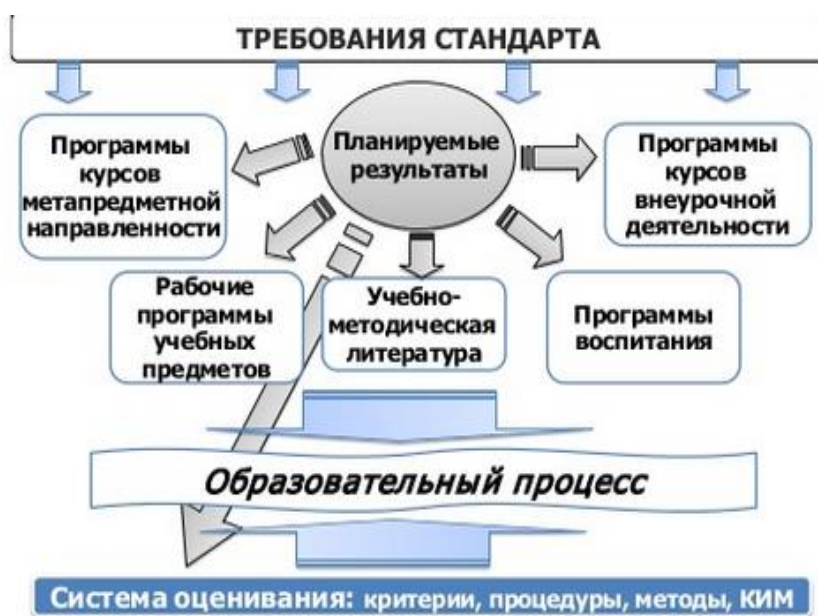
Рис. 1. Содержательная основа образовательной программы

В соответствии с требованиями ФГОС система планируемых результатов – личностных, метапредметных и предметных – устанавливает и описывает классы учебно-познавательных и учебно-практических задач , которые осваивают обучающиеся в ходе обучения, особо выделяя среди них те, которые выносятся на итоговую оценку, в том числе государственную итоговую аттестацию выпускников. Успешное выполнение этих задач требует от учащихся овладения системой учебных действий (универсальных и специфических для данного учебного предмета: личностных, регулятивных, коммуникативных, познавательных) с учебным материалом , и прежде всего с опорным учебным материалом , служащим основой для последующего обучения.