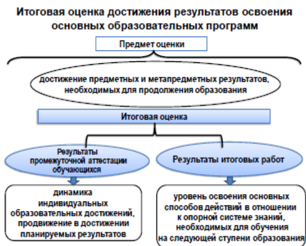
Рис. 4. Достижение предметных и метапредметных результатов, необходимых для продолжения образования. Итоговая оценка.

На итоговую оценку на ступени основного общего образования выносятся только предметные и метапредметные результаты , описанные в разделе « Выпускник научится » планируемых результатов основного общего образования (рис. 4)