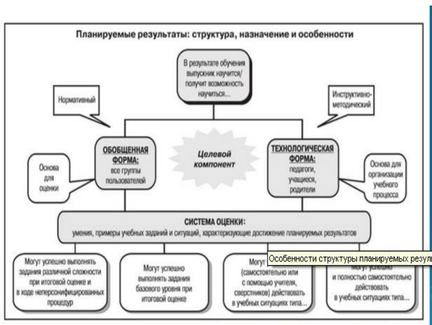
Рис. 3. Особенности структуры планируемых результатов. Функция и назначение.

Оценка как средство обеспечения качества образования предполагает вовлеченность в оценочную деятельность не только педагогов, но и самих учащихся. Оценка на единой критериальной основе, формирование навыков рефлексии, самоанализа, самоконтроля, само- и взаимооценки дают возможность учащимся не только освоить эффективные средства управления своей учебной деятельностью, но и способствуют развитию самосознания, готовности открыто выражать и отстаивать свою позицию, развитию готовности к самостоятельным поступкам и действиям, принятию ответственности за их результаты. С этой точки зрения особенностью системы оценки является ее «естественная встроенность» в образовательную деятельность.